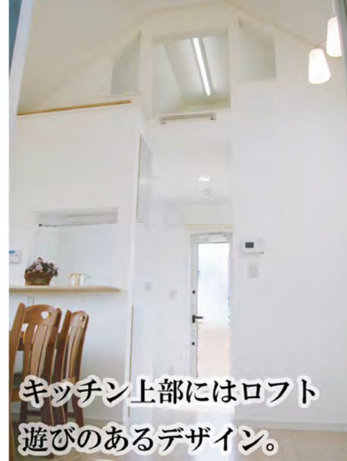
キッチン上部にはロフト 遊びのあるデザイン。