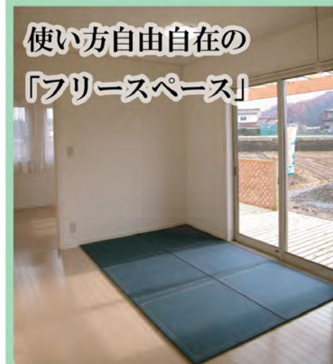
使い方自由自在の 「フリースペース」