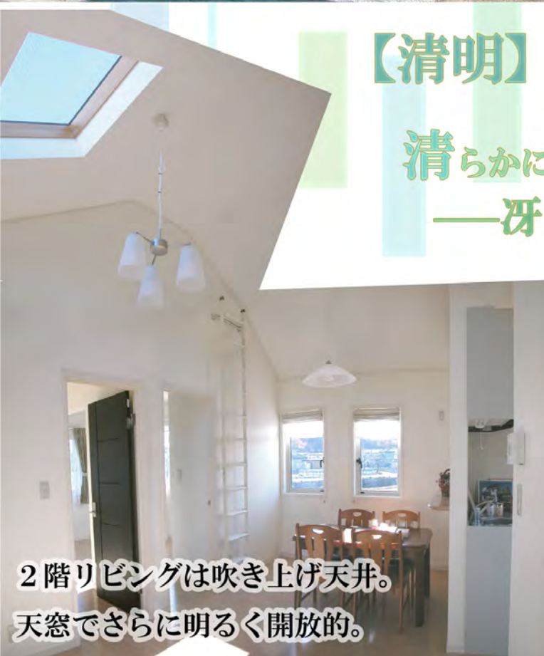
2階リビングは吹き上げ天井。 天窓でさらに明るく開放的。