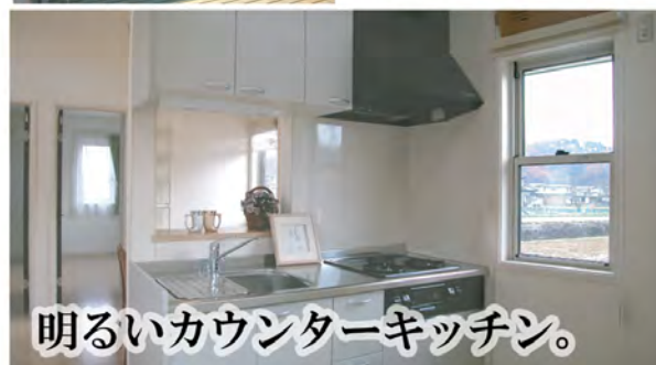
明るいカウンターキッチン。

2階ウッドデッキを継承しながら、 暮らしやすさに重きを置いたデザイン。 天窓のある明るい2階リビングや、 家事にも客間としても使えるフリースペース ほかとは違う、だからこそマイホーム。