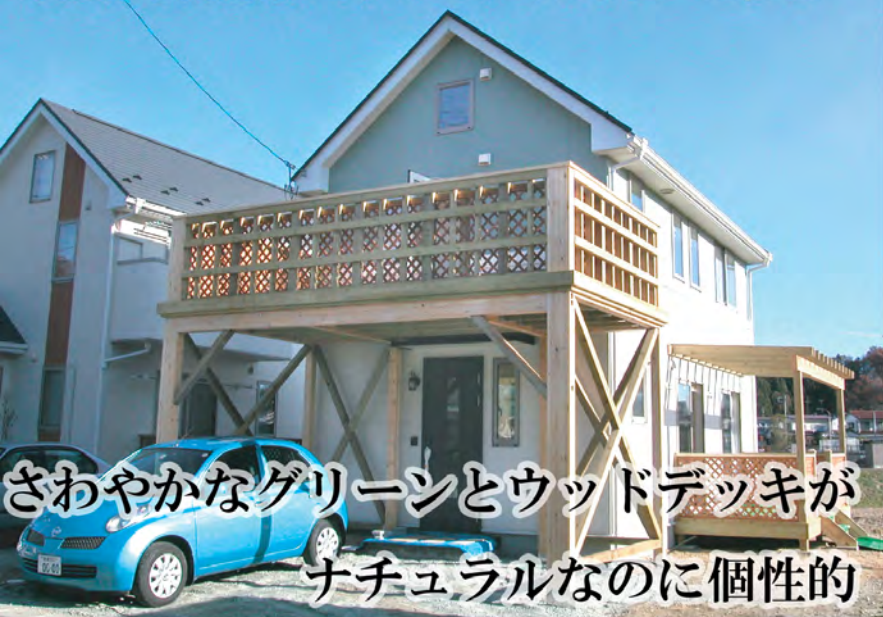
さわやかなグリーンとウッドデッキが ナチュラルなのに個性的